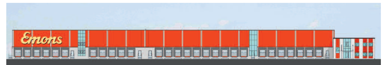
Im Nürnberger Bayernhafen baut die Emons Spedition GmbH zwei Speditionsumschlaghallen sowie ein zweigeschossiges Büro- und Verwaltungsgebäude. Die Projektentwicklung bis zur schlüsselfertigen Übergabe erfolgt durch die LIST BAU Bielefeld.