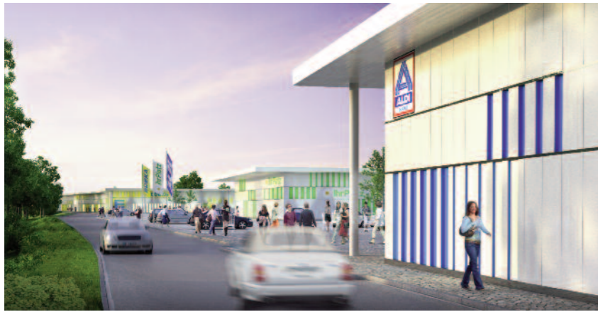
Insgesamt fünf Fachmärkte werden auf dem ca. 20.000 m 2 großen Grundstück um den Mendener Bahnhof entstehen. 70% der Flächen sind bereits an führende Handelsunternehmen vermietet.

Das Bahnhofsgebäude und der Vorplatz werden Entrée für die Bahnsteige und das umliegende Fachmarktzentrum sein, das Areal wird damit wieder in die Innenstadt integriert. So, wie sich jetzt die Mendener Bürger über den maroden Zustand „ihres“ Bahnhofs ärgern, so sehr sollen sie demnächst wieder stolz auf diesen besonderen Ort ihrer Stadt sein.